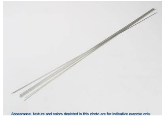
Appearance, texture and colors depicted in this photo are for indicative purpose only.

Magna 506 TIG “ Ultima Generación” Metal de aporte con alta resistencia para soldadura de aluminio, es un alambre TIG de aluminio versátil y fácil de usar. Tiene excelente resistencia a la tracción como al corte y permite tratamiento térmico una vez soldado. Magna 506 es un moderno aporte TIG para soldaduras de mantenimiento de las aleaciones de aluminio más utilizadas y la combinación de estas aleaciones de aluminio.